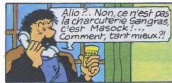
(2) voir "Tientien et les syndicats"